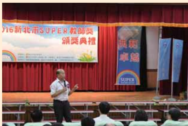
Super 教師頒獎典禮來賓致詞