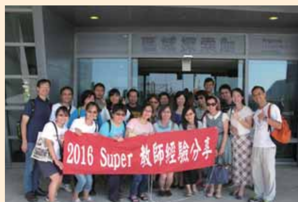
Super 教師經驗分享研習 (海科館場)