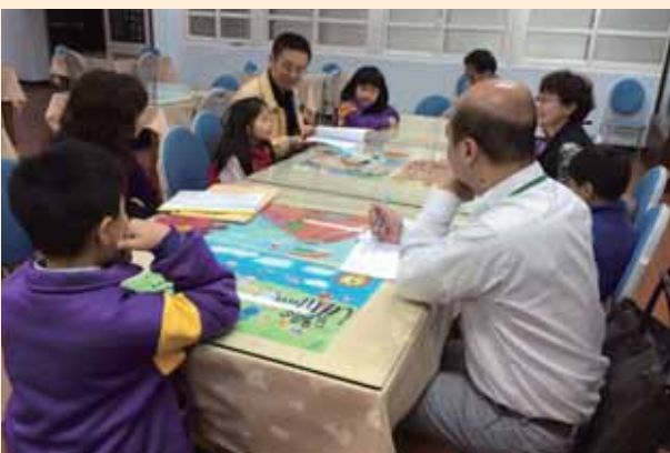
評審委員校園訪視