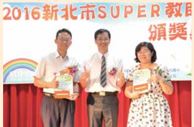
Super 教師網路票選最佳人氣獎