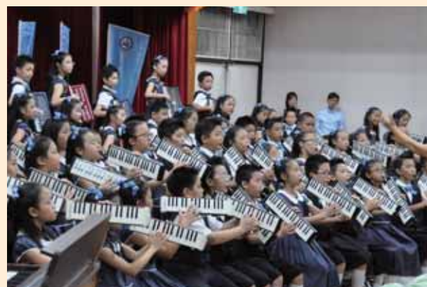
Super 教師頒獎典禮表演活動