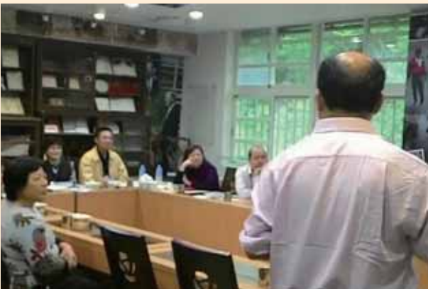
評審委員校園訪視