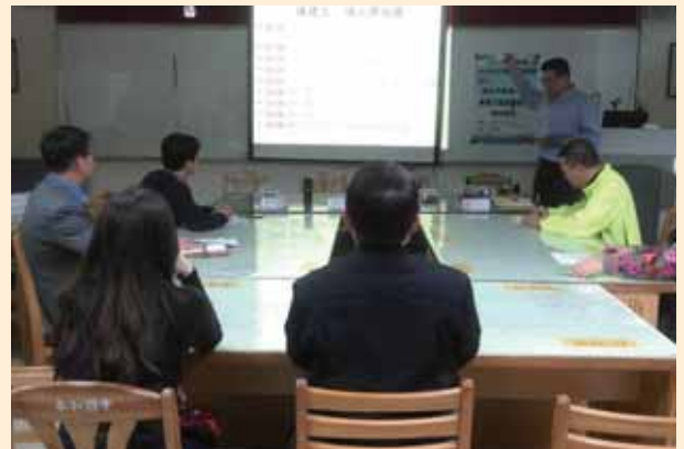
評審委員校園訪視