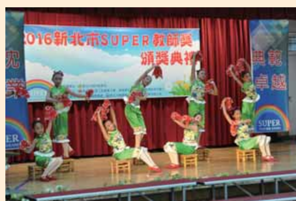
Super 教師頒獎典禮表演活動