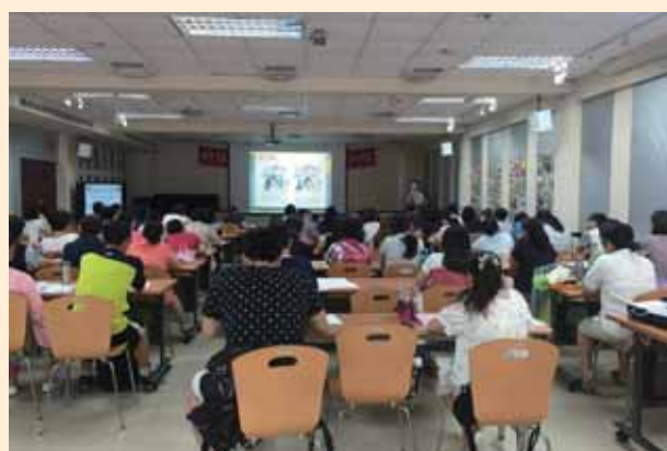
Super 教師經驗分享研習 (網溪國小場)