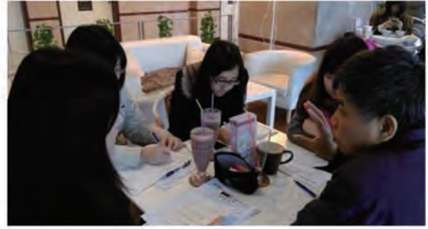
2. 新進志工面談訓練，說明志工角色、服務守則和各種障別服務經驗