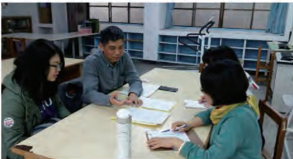
3. 志工開始服務前，本會陪同到校與個管老師或導師面談，了解學生狀況