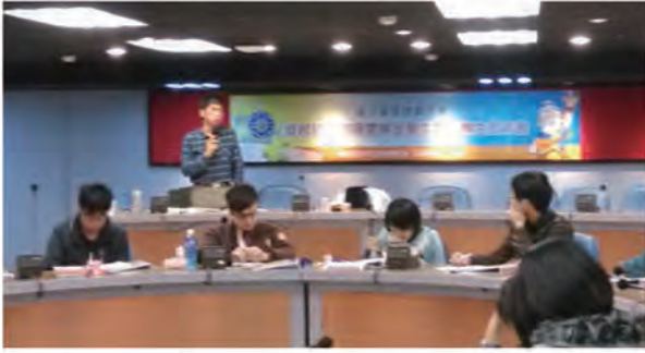
1. 到各大學師培中心說明特教志工計畫招募志工