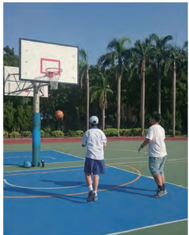
4-3. 志工服務：陪需要肢體加強的孩子運動