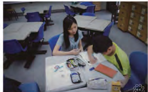
4-1. 志工服務：個別輔導