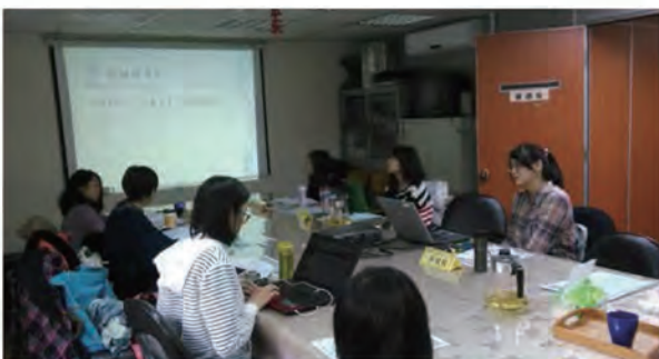
5. 特教協助志工期中訓練：志工經驗分享