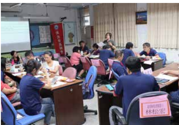
第 9 屆第 8 次理事會 (教師會)