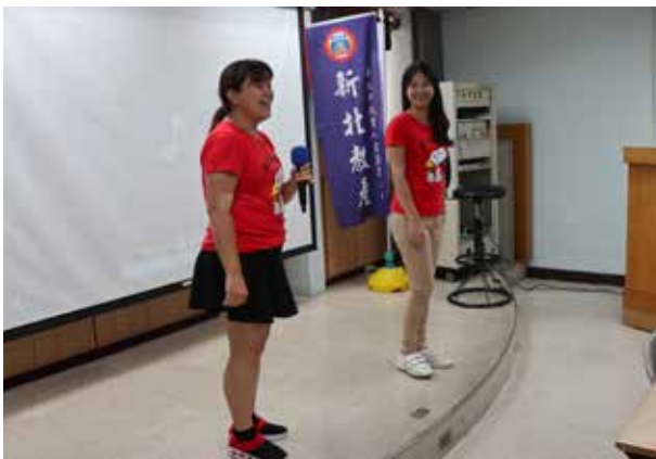
SUPER 教師經驗分享暨資訊教學 (三重勞工中心)