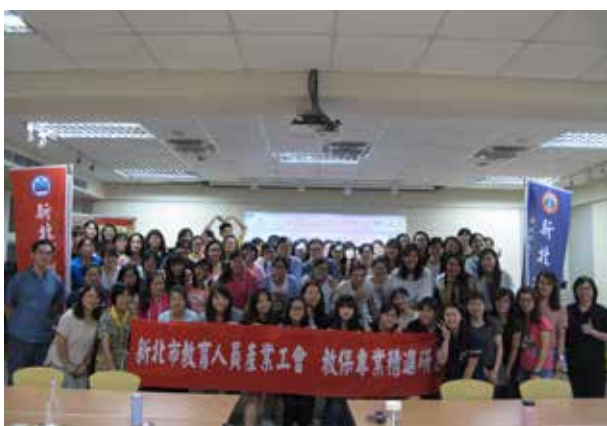
教保人員勞工意識與專業精進研習 - 網溪國小