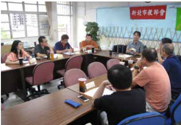
第三屆第五次國中委員會