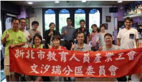
107 年暑期分區座談 - 文汐瑞分區 (汐止場)