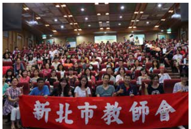
教師專業發展支持系統 - 107 年度「班級經營與師生對話」研習