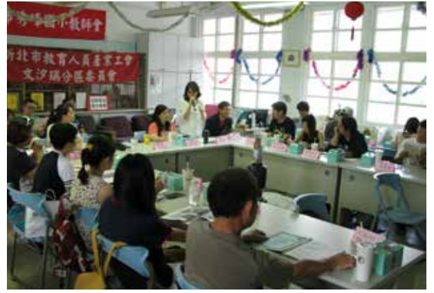
107 年第 1 次文汐瑞分區委員會