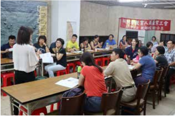
SUPER 教師經驗分享暨環教研習 (芝山文化生態綠園)