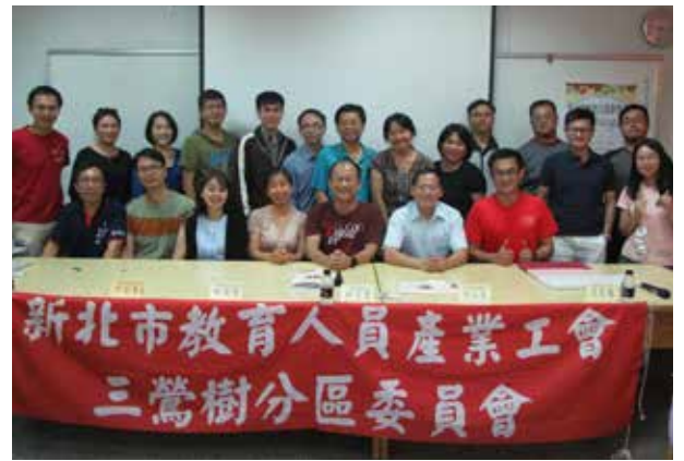
107 年第 1 次三鶯樹分區委員會