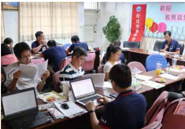
第 3 屆第 9 次理事會 (工會)