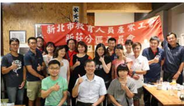
107 年暑期分區座談 - 新莊分區 (新莊場)