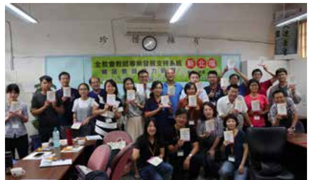
全國教師會觀議課培力 - 薩提爾溝通工作坊新北場