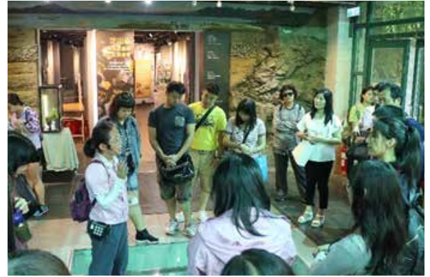
SUPER 教師經驗分享暨環教研習 (芝山文化生態綠園)