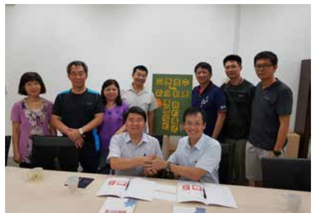
安康高中團約簽署