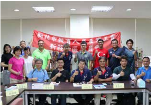
107 年第 1 次新莊分區委員會