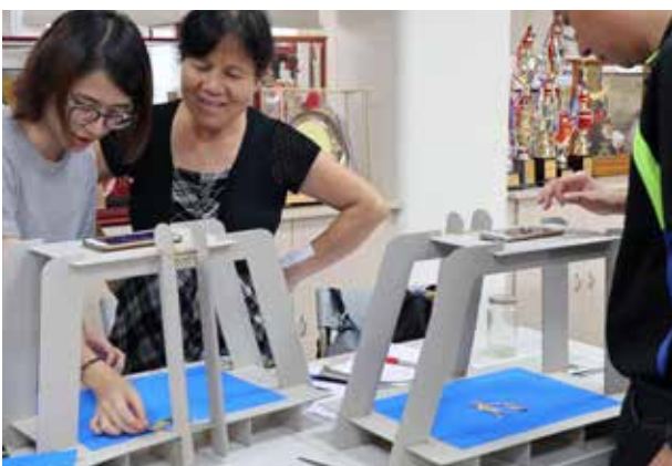
精進研習 --- 用桌遊進入程式大門及數位時代的隱形優勢停格動畫製作