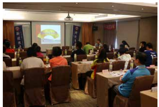
勞工教育訓練 (蘆洲成旅晶贊飯店)