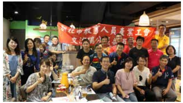
107 年暑期分區座談 - 文汐瑞分區 (新店場)