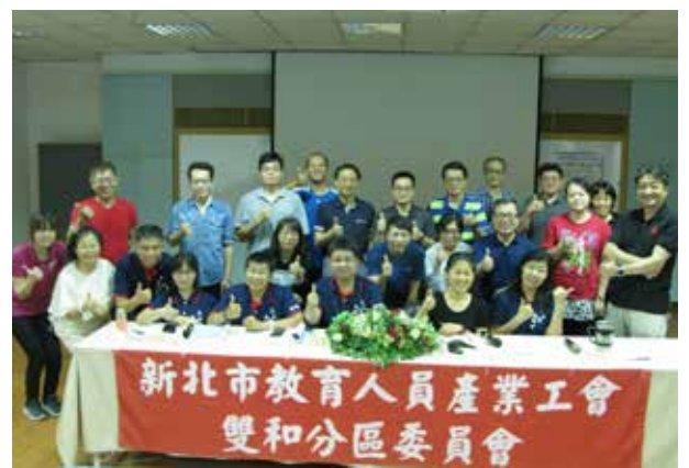
107 年第 1 次雙和分區委員會