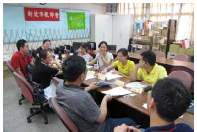
第三屆第五次幼教委員會