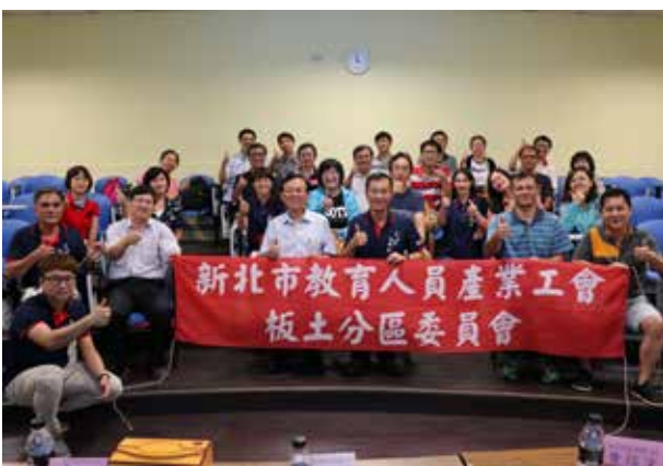
107 年第 1 次板土分區委員會