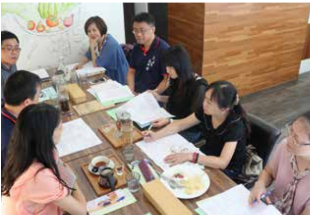
107 年暑期分區座談 - 重蘆淡分區 (淡水場)