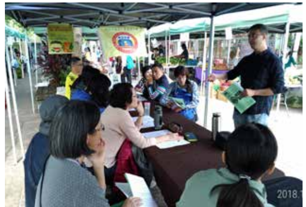
有機市集食農教育研習