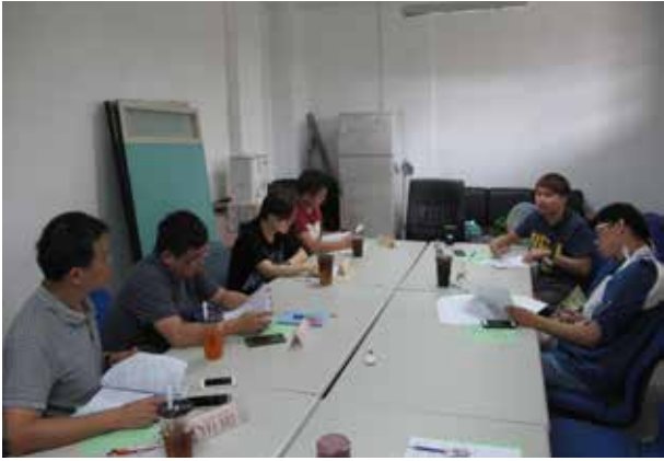
第三屆第五次特教委員會