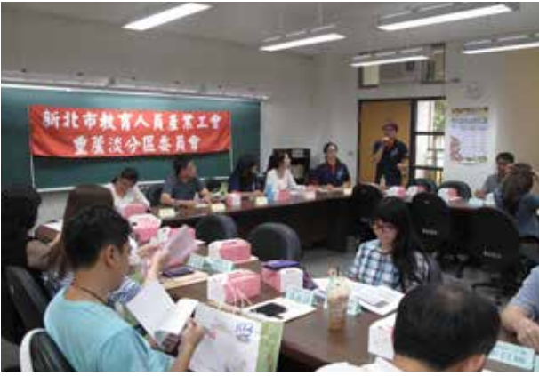
107 年第 1 次重蘆淡分區委員會