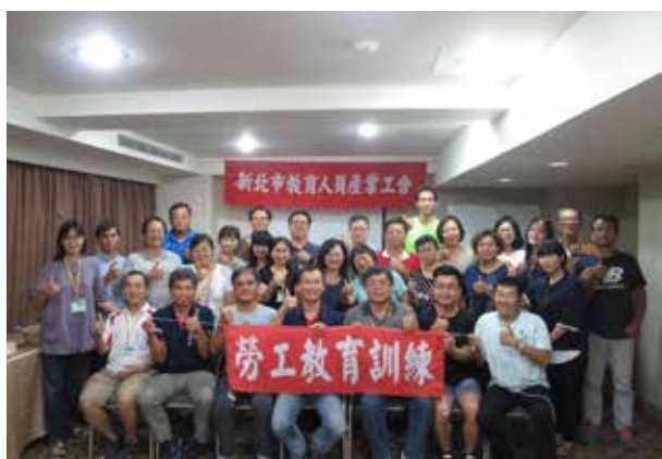
107 年度勞工教育訓練 (淡水)