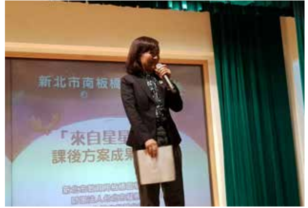
永齡基金會課後方案成果發表