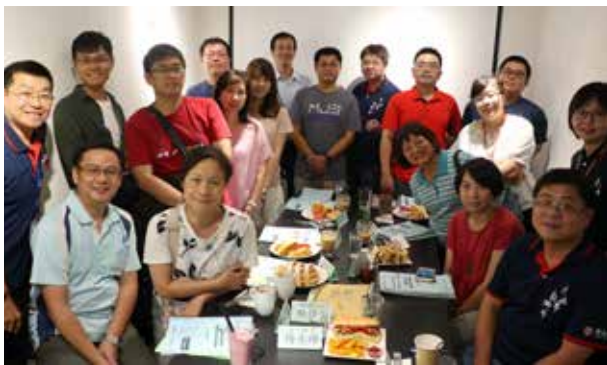
107 年暑期分區座談 - 雙和分區