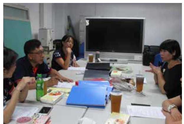
第 9 屆第 7 次監事會 (教師會)