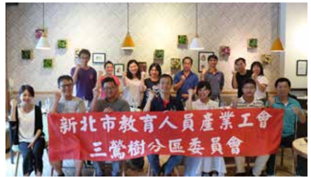
107 年暑期分區座談 - 三鶯樹分區