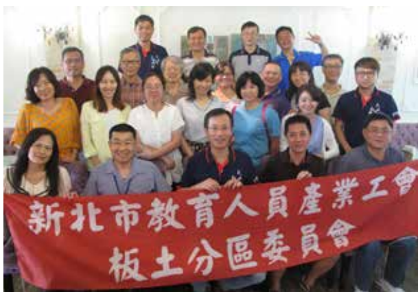
107 年暑期分區座談 - 板土分區