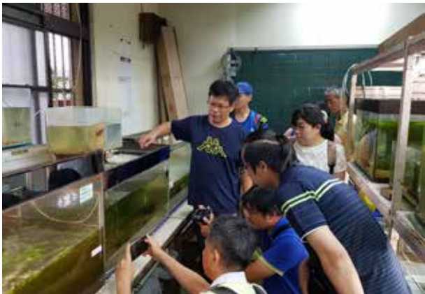
精進研習－認識台灣原生魚類 (裕民國小)