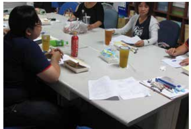
第 3 屆第 7 次監事會 (工會)