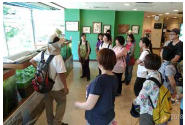
水資源研習 (關渡自然公園)