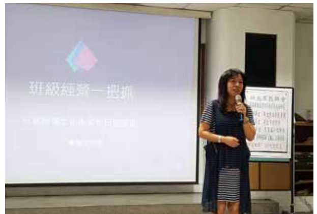
精進研習－班級經營及親師關係 (思賢國小)