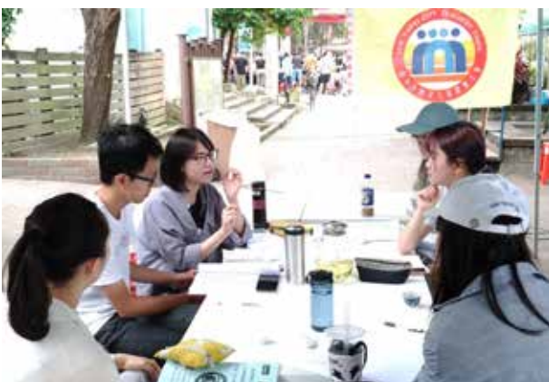
107 年第 1 次志工期中訓練