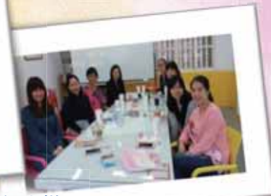
桌遊的運用，讓課堂變成快樂的學習場域。