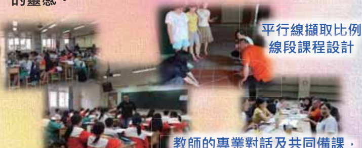
平行線擷取比例線段課程設計

平行線擷取比例線段課程設計暨校際共備課程共備之群組老師透過地板上磁磚與童軍繩的使用，來讓學生能清楚知道如何利用周遭的一些既有工具來將繩子N等分。在這次共備課程中，有部分老師是來自鄰校的蘆洲國中教師，當一起討論的老師越多時，可以激盪出更多的想法或靈感，其中討論到圓與點的位置時，有老師提出亞運會的空氣槍計分方式不就是在講這個理念嗎？(子彈留下的痕跡越靠近圓心，所得到的分數越高)其他老師便開始研究這項比賽的規則，甚至還有老師提出那推酒杯的遊戲可以與直線與圓的位置關係相結合嗎？再次驗證越多老師一起激盪可以得到更多的靈感。