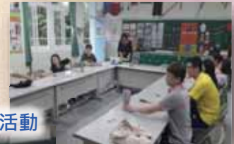
心理師介紹樹卡活動