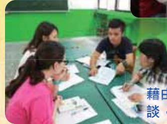
藉由教師間的專業對談，提升經驗交流。