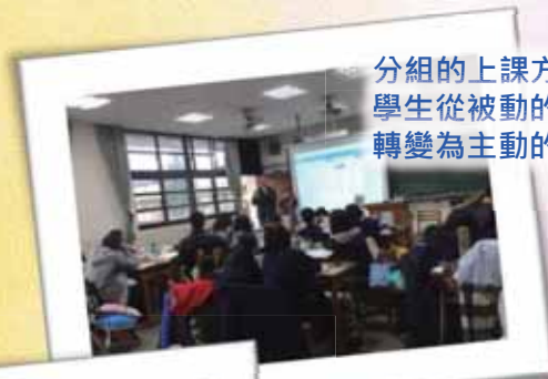
分組的上課方式，讓學生從被動的接受者，轉變為主動的探索者。