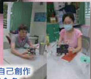
展示並表達自己創作的創思與命名