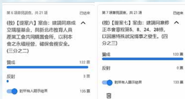
1100723會員代表大會視訊會議提案表決截圖

回顧一〇九年三月的會員代表大會，在落實嚴謹防疫措施的規畫下，135位會員代表帶著高度警戒的心情在假日出席，進行大會程序並完成改選，以配合出席會議來充分展現對會務的支持。一一〇年五月十五日行政院與中央流行疫情指揮中心發布，提升雙北疫情警戒至第三級；雙北柯文哲市長、侯友宜市長決議雙北高中職以下學校、補習班及安親班自五月十八日至廿八日全部停課。全國展開與疫情搏鬥、共存的生活，自一〇九年初到一一二年四月，本會前後共參加了130場次的防疫會議，幾乎每次都積極傳達教學現場防疫的困境、負擔及壓力，提醒行政採取更有實益的防疫作為，創造校園防疫的自主空間，屢屢獲得教育局的支持與協助。