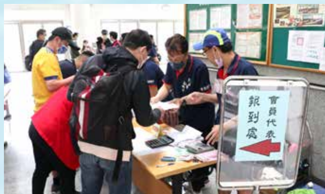
1120324會員代表大會報到

部），感謝大家三年來的支持與協助。這一切，都是因為有每個支會會長及會員的認同與肯定，大家才能一起用團結凝聚，創造了會務的里程碑。松宏也很榮幸在三月卅一日承蒙教師會第十一屆／工會第五屆理事夥伴抬愛，連任理事長，任期將自一一二年八月一日至一一五年七月卅一日。未來三年需要大家更多的參與和協助，持續為新北教師創造更多的幸福感。