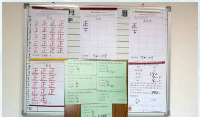
1100706書面表決案開票紀錄

於此同時，三年來我們也檢視本會章程及各項內部章則，讓會務運作更合乎法令、更順暢，同時也擴大與其他教育團體、工會的互動，更增加參與公益的能量，創造提升本會的能見度。另外，在積極要求教育局應投入更多資源，提升教學環境及教師權益外，我們在200多位學校教師會理事長配合協助之下，幾乎全數達成更名及改選報府的複雜任務，更輔導協助成立了7所學校教師會。這些看似細瑣、不影響新北教師會會務的小事，其實正是學校教師會經營的大事。包括如何讓校長、行政願意主動尊重教師會理事長，學校各項重要會議有無教師會代表，教師會內部如何整合凝聚、傳承延續，以及如何擴散提升學校教師會理事會的參與及影響力等，其實都是我們要讓教師組織更強大、更穩定長遠發展的重要課題。