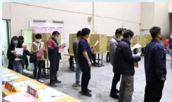
1120324會員代表大會投票

我覺得，理事長只是一把椅子，不是一個有距離的頭銜或名字。剛好坐在位子上的人，就盡己所能發揮最大價值，為教師爭取應有各項權利及尊重；而理事會及幹部