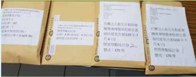
1100706書面表決同意票數資料

107年7月6日，本會以書面決議方式同意成立購屋基金，與新北市教育人員產業工會共同購置會所，以利本會之永續經營。發出書面投票單205份，回收187+7=194份，回傳參與率96%；同意提案共170票，支持同意率91%。符合章程之變更，應以出席會員代表四分之三以上同意或全體會員代表三分之二以上書面同意之表決門檻。